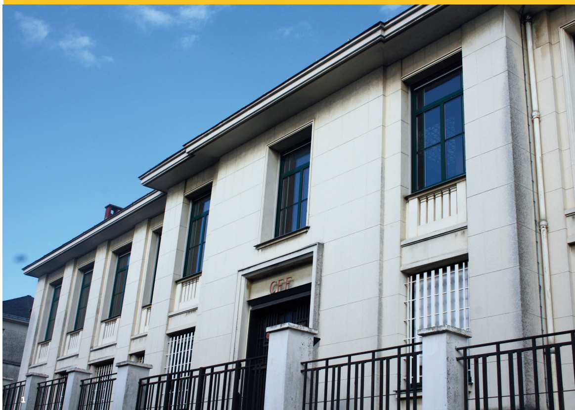
1. Façade ouest du Crédit Foncier avant travaux